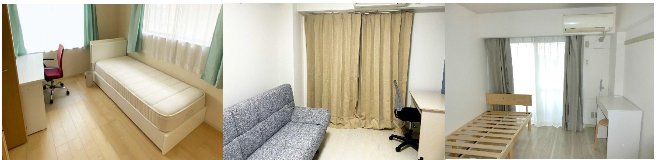
ポウロニアン・ハウス

その他、宮城県仙台市（ポウロニアン・ハウス）にて 5部屋 東京都世田谷区（三軒茶屋・用賀）にてワンルーム 5室 が稼働中です。